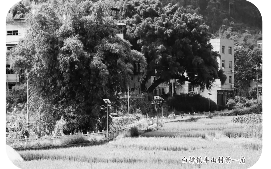
白樟镇半山村景一角