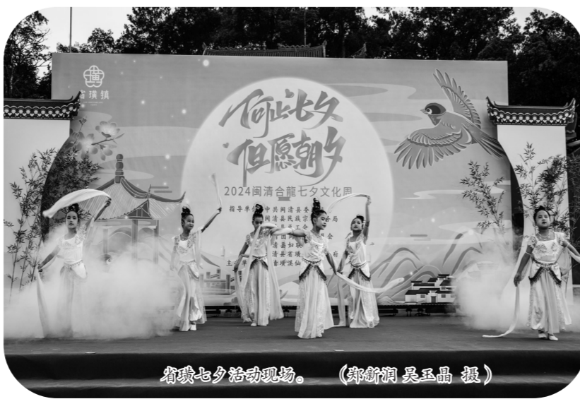
鹤顶七夕活动现场。

的游园活动依次上演,带领市民游客感受七夕的浪漫与文化魅力。现场还举办了丰富多彩的七夕晚会,《天官乐舞》《小美满》《醉春风》等一系列文艺表演轮番上演,优美的舞姿与动听的歌声,传递节日的喜悦与浪漫气氛。现场笑声和掌声此起彼伏。现场还布置了民俗文化体验区,以及各族服饰展示及七夕主题文化市集,各类好礼及美食纷纷亮相,吸引市民游客品鉴。(福州日报)