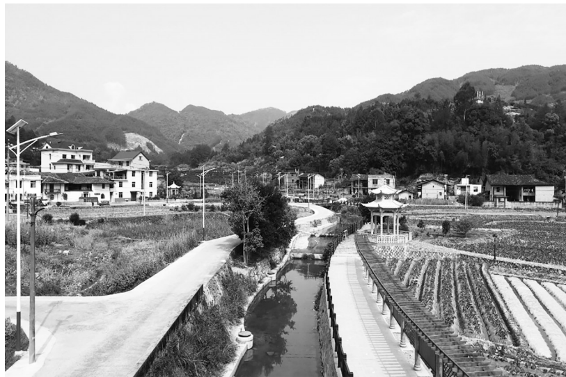
积分奖励,让百姓主动干

去年以来,闽清县在县域内全面推广积分制,用积分兑换生活用品等方式,引导村民主动参与家园清洁行动、乡村建设、文明实践等,将“村里事”变“家里事”,激发农民投身乡村振兴的意识,不仅扮靓了乡村环境,还吹来了文明新风。