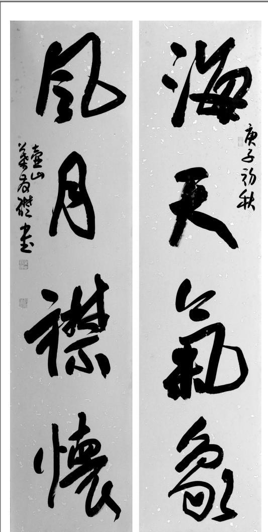
海天气象 风月襟怀