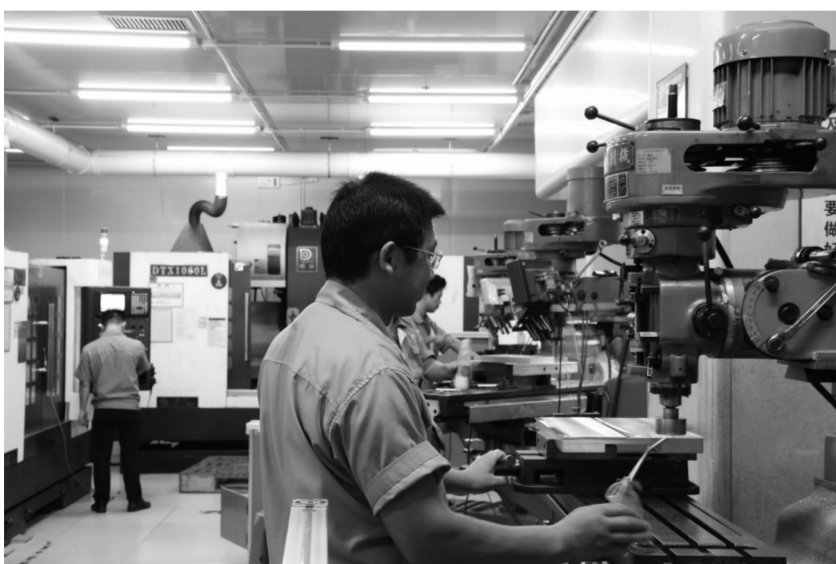
中源智人科技公司生产车间一角

认准了方向,再大的困难黄道权都要坚持下去。他经常与员工们说挖井的故事,与其三心二意挖九个井,不如专心挖一个井。不要看到了希望才去坚持,而是因为坚持了才会看到希望。2008年世界金融危机时,企业也遇到了很大困难,市