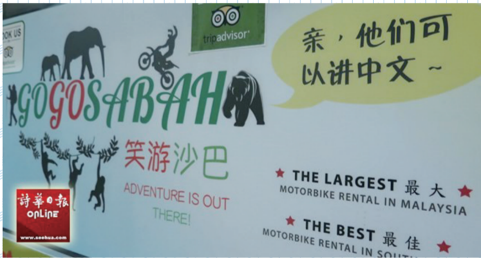
图为随着中国游客日益增加,亚庇市区多间旅游公司也设中文翻译,招揽游客生意。

“这些‘说走就走’的年轻员工工作不到半年,最长的顶多一年多就离职。”她否认现在年轻员工普遍思维活跃、独立,要想留住他们,确实不容易。