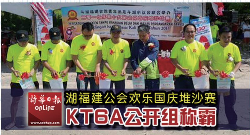
湖福建公会欢乐国庆堆沙赛 KT6A公开组称霸

社团组方面,华联青勇夺冠军,福州公会青年团夺得亚军,四邑公会青年团和潮州公会青年团则分别获得季军、殿军。至于18岁以下青少年组,冠军则由KV Junior赢得,KV Warrior获得亚军,季、殿军分别落入Visual UMK和18th Scout Tawau手中。