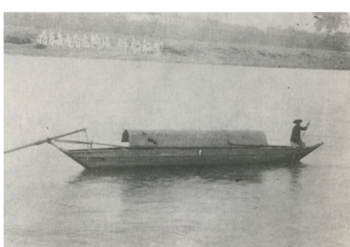
(上图为鼠船,左图为雀船。)

出版文史资料《闽清鼠船和米船》,不仅刻不容缓,而且极具意义,它将为闽清后人留下一笔极其宝贵的历史文化遗产。