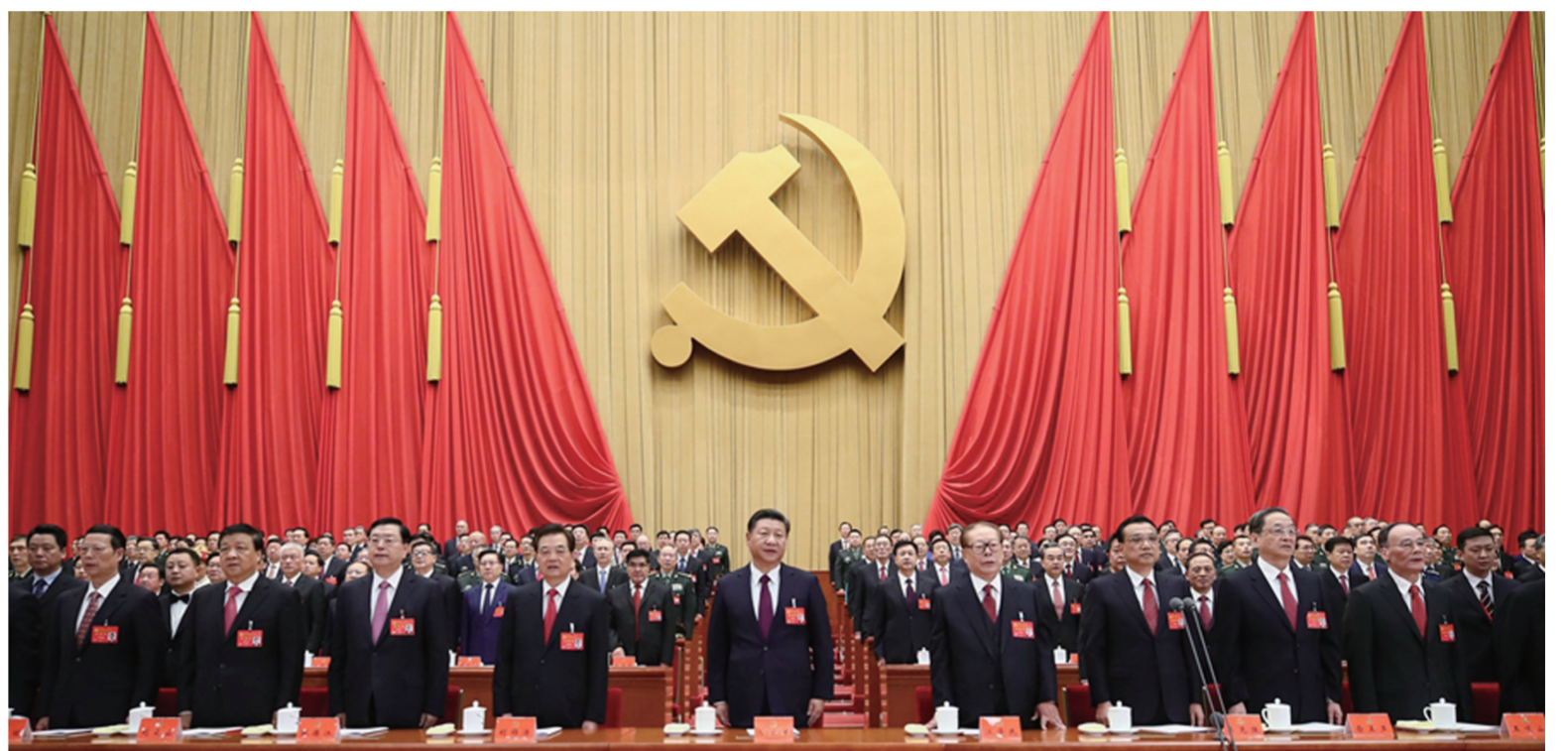
习近平、李克强、张德江、俞正声、刘云山、王岐山、张高丽、江泽民、胡锦涛在主席台上。