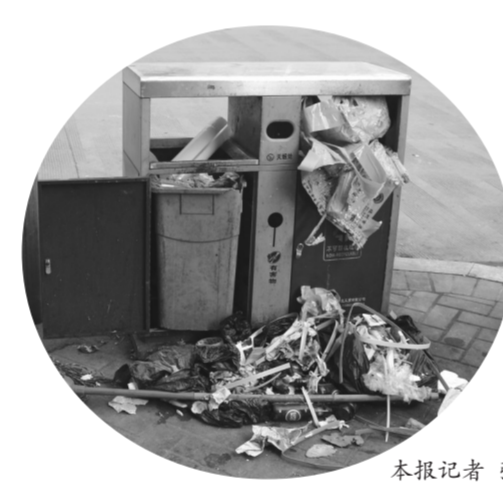
恒晟晶都街乱堆垃圾