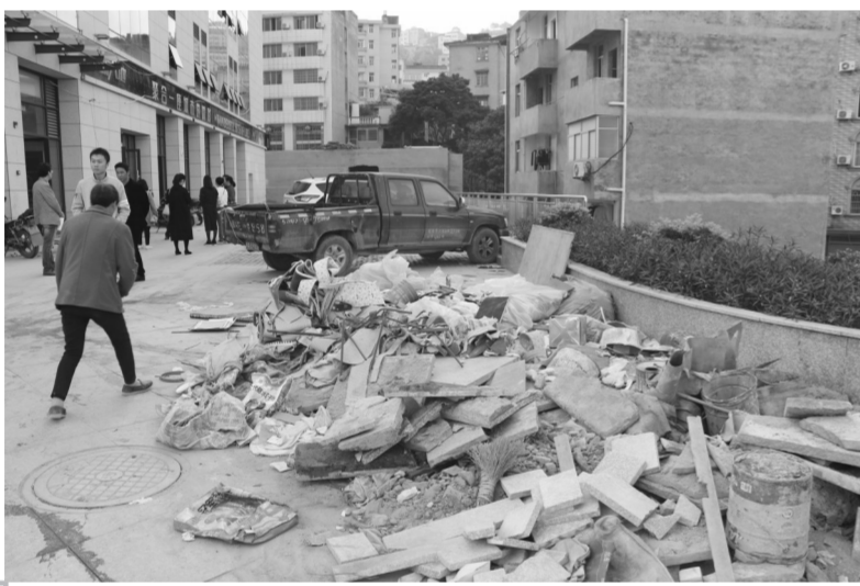
百荣房地产门口建筑垃圾满地