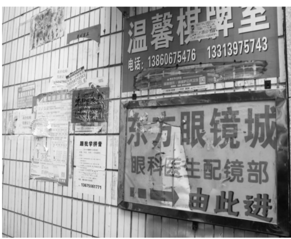
南门居委会门口还存在乱张贴广告现象