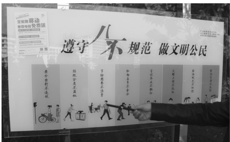
洋桃公园的“八不”宣传牌上,移动公司商业广告赫然在上