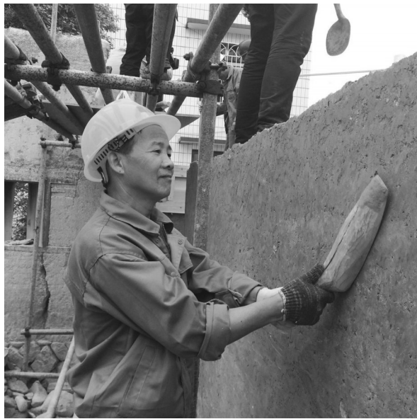
一层添加了糯米汤的黏土。这次,宏琳厝修复用的是版筑夯土墙,它以木板作模,内填黏土,层层用沉重的木杵夯实。

记者看到,夯土墙工艺复杂,需要四道工序——首先要取当地田里第二层的宝盖土,然后掺入石灰、粗砂、碎瓦片,调制备用土料,再分层夯实,墙面晾干后还要覆盖